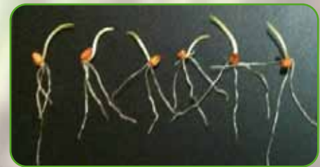
Real ® Top