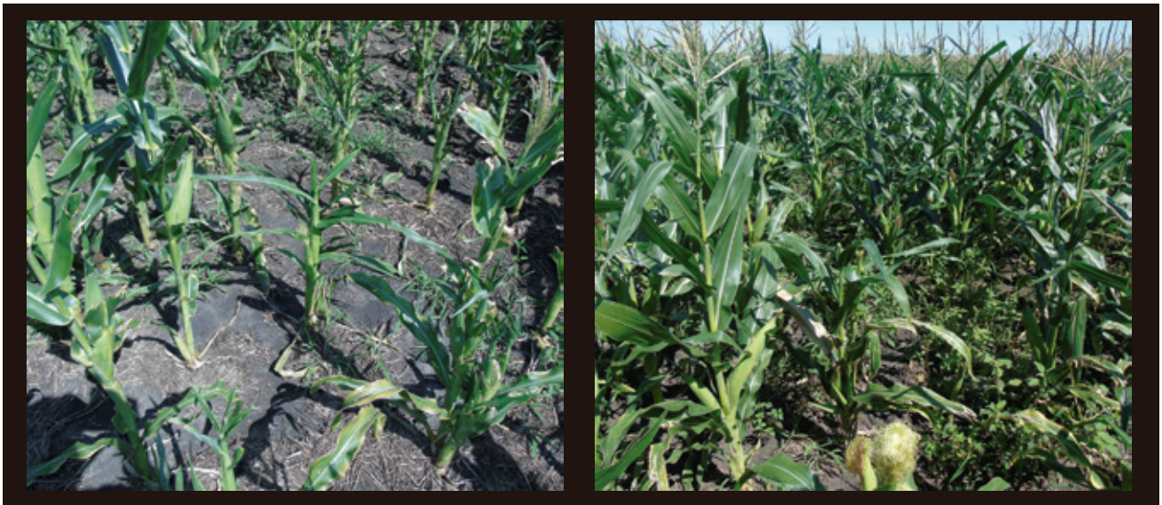
Control de Amaranthus sp y Digitaria sanguinalis . (Young – Híbrido: NK 875 – Oct. 2018)